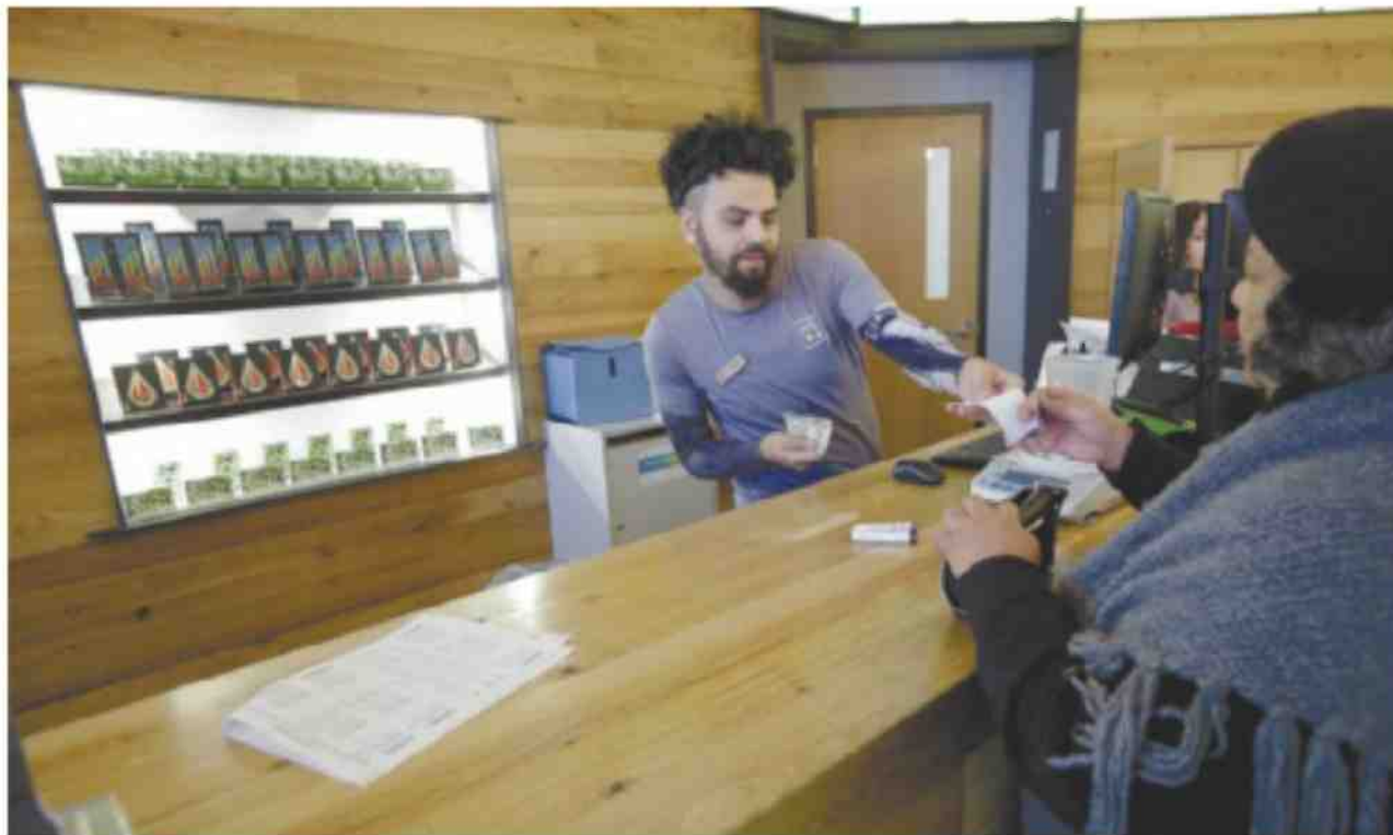
נקודה למכירת קנאביס (Dispensary) במסצ'וסטס

יאיר גבע: "חברות קנדיות ואוסטרליות, שרק מגדלות קנאביס, רוצות להיות הקוקה קולה הבאה. בשביל זה הן צריכות נוסחה ייחודית. עליהן להיות מתוחכמות יותר, ולכן להצטייד בידע ישראלי"