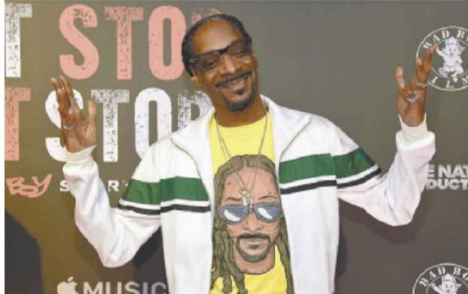
סנופ דוג. משקיע בסטארט-אפים של קנאביס